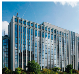
Das VR Payment Gebäude in Frankfurt am Main